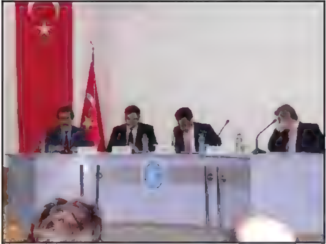
Birinci Oturum – Türk Batı İlişkileri